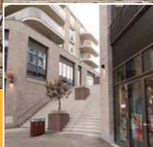
Nieuw Kijkduin, toegankelijk voor iedereen?