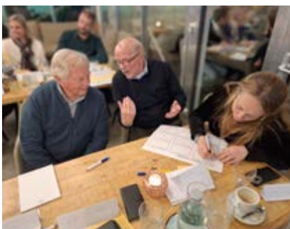
Discussie over de positionering van Kijkduin

Op 30 januari was er in de serre van Golfclub Ockenburgh een bijeenkomst over de toekomst van Kijkduin. In feite ging het hier om branding, de aandacht vestigen op het "merk" Kijkduin. Gemeentelijk bureau Citybranding organiseerde de avond. Diverse belangenorganisaties waren uitgenodigd om te inventariseren op welke betekenis Kijkduin heeft of kan krijgen voor inwoners van Den Haag en/of voor de buiten(wereld). Wij hebben ons best gedaan om van alles te bedenken, niet alleen voor Kijkduin-Bad, maar ook voor de ruimere omgeving. Na nog een vervolg in april, komt er in mei een positioneringsdocument.