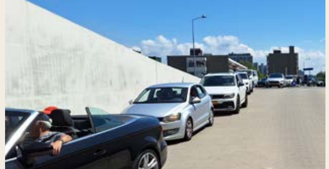
Filevorming bij de ingang van de parkeergarage

te vinden. Ook op drukke dagen is daar nog veel plaats. Een ander verhaal is het stallen van scooters en motoren. Al ruim 15 jaar geleden, bij de voorbesprekingen van het Masterplan Kijkduin, is door de bewonersorganisaties er al op gewezen dat nauwelijks ruimte was gereserveerd voor deze vervoermiddelen. Nu de openbare ruimte in Kijkduin-Bad vorm begint te krijgen, blijkt in de praktijk dat er structureel te weinig voorzieningen zijn getroffen.