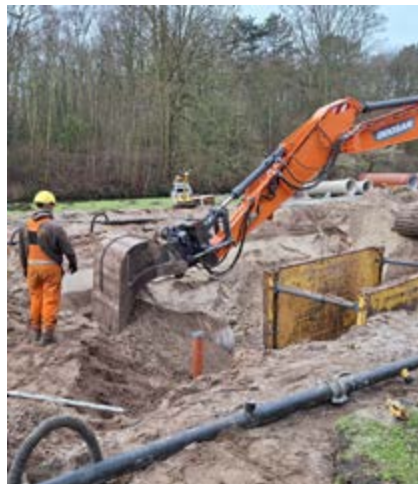
Werk aan de riolering in de Muurbloemweg

Bij de adressen van de wegen die aan de beurt zijn heeft de Gemeente flyers bezorgd met meer informatie. Ook de website Alle werkzaamheden aan de weg - Bereikbaarheid Den Haag , biedt een goed overzicht van de gevolgen voor het verkeer.