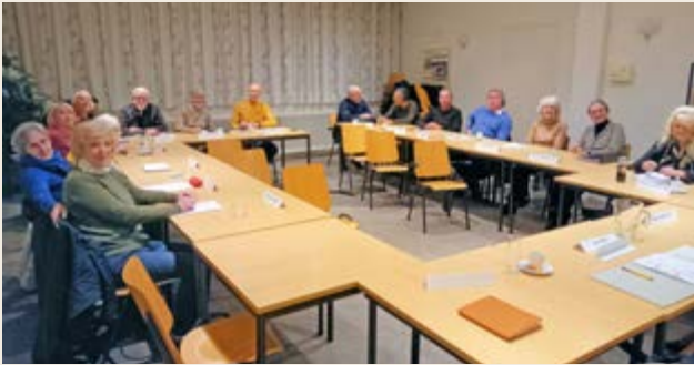
Vergadering Ogen en Oren