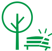
Kapotte bankjes of lantaarnpalen