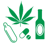
Gebruik van drugs, lachgas of alcohol