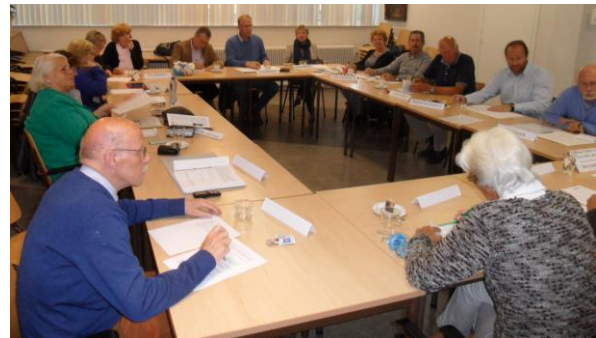
Vergadering Ogen en Oren