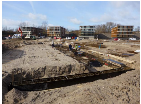
Finest of Ockenburgh

Op de voormalige tennisbanen (ontwikkellocatie B1 van het Masterplan Kijkduin) is ontwikkelaar Synchroon begonnen met The Finest of Ockenburgh . Eind 2019 waren de vijf appartementgebouwen al in vergevorderde staat en is men begonnen met het slopen van het oude clubgebouw en met de werkzaamheden voor de grondgebonden woningen.