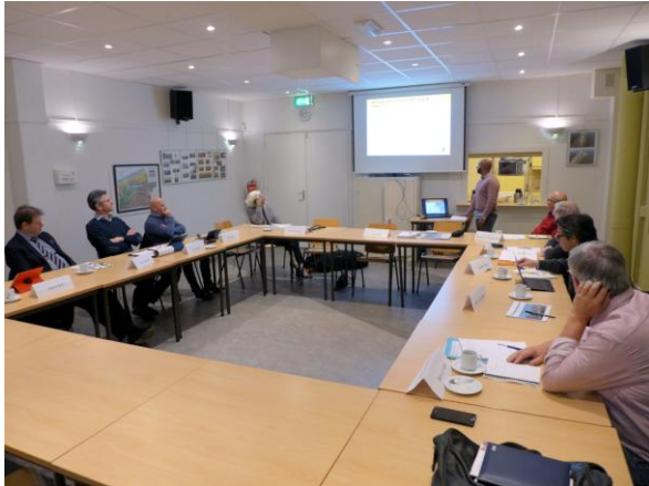
Vergadering werkgroep Kijkduin-Binnen en -Infra

Voor de begeleiding van de projecten in Kijkduin-Binnen zijn de werkgroepen Kijkduin-Binnen en Kijkduin-Infra samengevoegd. Samen met vertegenwoordigers van Gemeente, AVN en ontwikkelaars, wordt regelmatig overlegd over o.a. het landschappelijk raamwerk, de bouwlogistiek, de verkeersafwikkeling en de parkeerproblematiek. De werkgroep is in 2019 vier maal bijeen geweest.