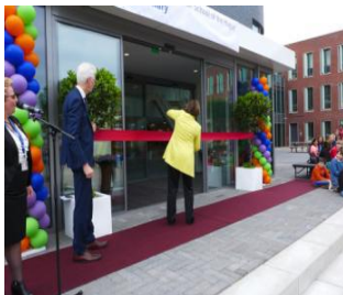
Opening van de uitbreiding van de ISH