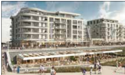
Impressie Nieuw Kijkduin (Afb. FRED)

De uitvoering van de herontwikkeling van Kijkduin Bad door eigenaar/ontwikkelaar FRED Developers ligt op schema. Fase 1 van het winkel- en horecagebied met appartementen omvat de eerste twee gebouwen aan de noordzijde (tegenover het hotel) en omvat 31 koopappartementen aan de zeezijde en 38 huurappartementen aan de landzijde, 5900 m 2 commerciële ruimte en 130 parkeerplaatsen. Aansluitend aan fase 1 is begonnen met fase 1,5, waar boven de versmarkt Daily Taste, supermarkt Coop en een aantal winkels en 43 huurappartementen worden gerealiseerd.