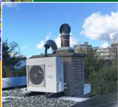
Ronald van Wuijtswinkel: "niet wachten met verduurzamen maar gewoon doen."

pag. 16 - 18 Verenigingsnieuws Verslag ALV 9 mei 2019 De straat waarin wij wonen Beeld in de Buurt