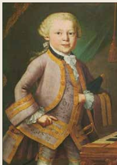
Een jonge Wolfgang Amadeus Mozart

was - en het paleis Noordeinde. Hij vond het prachtig. Maar hij was ook kritisch op enkele hotels waar ze sliepen, hij vond het vaak niet schoon genoeg. Zijn zusje Nannerl werd ziek, zodat de kleine Mozart eerst alleen moest optreden, daarna werd hij zelf ook ziek. Waarschijnlijk hadden ze allebei buiktyfus gekregen, maar gelukkig herstelden ze.