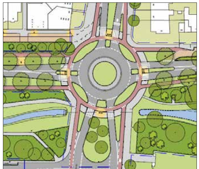
Rotonde De Savornin Lohmanlaan

Volgens deskundigen zorgen die voor een betere doorstroming dan met een regeling met verkeerslichten. Wij hebben wat twijfels, omdat ook fietsers op de rotonde voorrang hebben en door de ligging van o.a. scholen aan weerszijden van de weg vooral de ochtendspits met extra oponthoud te maken kan hebben.