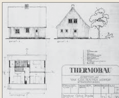
Schetsplan van een 'Oostenrijkse' woning uit 1946, gemaakt door de 'Teekenkamer Centrale Directie v/d Volkshuisvesting 's Gravenhage'

De houten woningen kennen een bijzondere geschiedenis: na de oorlog was er in Nederland een groot gebrek aan bouw materiaal en er was een tekort aan zo'n 500.000 woningen. Het ministerie van Wederopbouw en Volkshuisvesting bestelde in Oostenrijk houten montagewoningen. Deze woningen konden in een paar dagen in elkaar worden gezet en werden voor een deel in natura betaald (groenten, vismeel, aardappels) aangezien er in Oostenrijk een groot voedseltekort was. Het waren de eerste woningen die geïsoleerd waren, met metaalfolie in de wanddelen. Deze huizen werden daarom ook wel 'Thermohuizen' genoemd. Er zijn zo'n 800 van deze huizen in Nederland neergezet tussen 1946 en 1948. In Kijkduin staan er twaalf, de meeste staan in Brabant, 230 huizen zijn daar geplaatst.