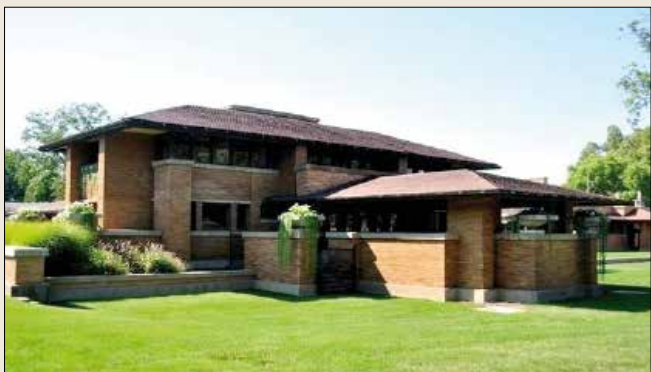
Het Martin-huis, een prairiehuis, ontworpen door Frank Lloyd Wright, Buffalo, New York, 1905. Dit huis heeft een oppervlakte van 15.000 vierkante meter.

Deze Amerikaanse prairiehuizen zijn vrijstaande huizen, het verschil met Nederland is dat de huizen in Nederland een-, twee-, of drie-onder-één kap-varianten hebben. Nederland is toch iets kleiner dan de VS.