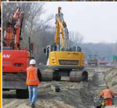
Werkzaamheden Noordwestelijke Hoofdroute bijna afgerond