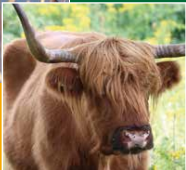
Waar komen die Hooglanders eigenlijk vandaan?

pag. 16 - 18 Verenigingsnieuws Uitnodiging Algemene Ledenvergadering 9 mei 2019 Jaarverslag 2018 De straat waarin wij wonen