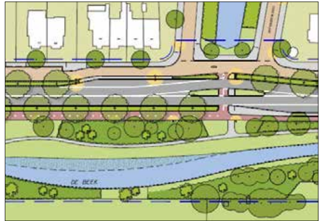
Ecologische opwaardering van de Haagse Beek bij de Oude Buizerdlaan

Stuwtes in de beek, het Verversingskanaal en duikers onder wegen maakten migratie van waterleven vrijwel onmogelijk. Uit onderzoek bleek bij de Sportlaan ook vrijwel geen waterleven aanwezig te zijn, mede door de schaduwwerking van de oeverbeplanting. Voor lopende en kruipende dieren vormen de wegen, het Verversingskanaal en de oude en nieuwe bouwwerken langs dat kanaal schier onoverkomelijke hindernissen. Alleen vliegend kan de fauna zich nog enigszins verplaatsen. Deze constatering leidde tot het opnieuw bekijken van de omgeving van de Haagse Beek. Er werden voorstellen gedaan om de beek plaatselijk te verbreden, milieuvriendelijke oevers aan te leggen en een meer open oeverbeplanting aan te brengen en - het is immers een beek - voor doorstroming te zorgen. Door deze ecologische kwaliteitsverbetering kon zonder al te veel bezwaar de Sportlaan met ca. 6 m worden verbreed. Zo ontstond ruimte voor een parallelweg langs de huizen en een vrijliggend fietspad aan de overzijde.