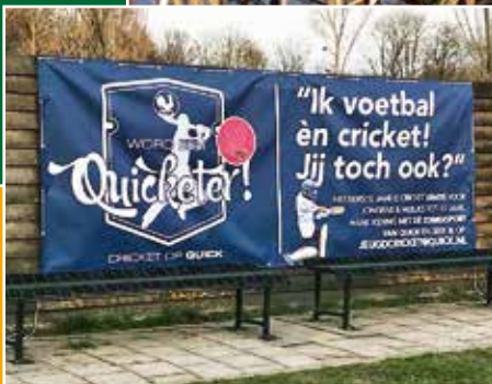
Jonge cricketers vertellen over hun sport