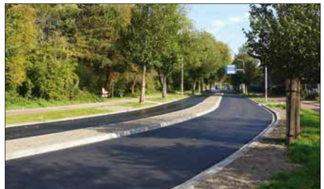
De Segbroeklaan, versmald tot 2 rijbanen

Verkeersmetingen toonden aan dat op de M. Vrijenhoeklaan vaak veel te hard werd gereden. Dat mag niet, maar een vierbaansweg die vanaf de Kijkduinsestraat niet vlak langs huizen loopt, is wel verleidelijk voor veel autobestuurders. De laan eindigt bij de tweebaans Sportlaan. Dat betekent dat doorstroming grotendeels bepaald wordt door de capaciteit van de Sportlaan. Wij hebben dan ook gepleit voor het veranderen van de M. Vrijenhoeklaan van vier naar twee rijbanen, een suggestie die is overgenomen door de Gemeente. De recente versmalling van de laan bij het tankstation en bij de Pyrolalaan lieten zien dat dit niet tot noemenswaardige vertragingen leidt. Dit principe is overigens ook overgenomen op de Segbroeklaan, waar de capaciteit op peil is gehouden door lange in- en uitvoegstroken.