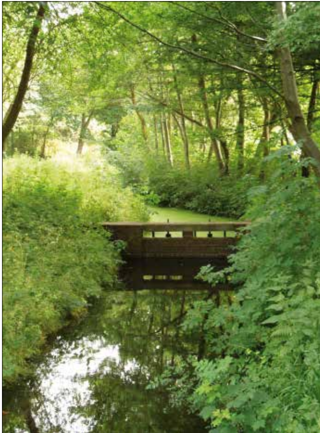
Stuw en beschaduwing van de Haagse Beek

Bij de Sportlaan vormde het gebrek aan ruimte een hindernis voor veilige aanpassingen. Smalle fietsstroken zonder afscheiding van de rijbaan, in- en uitritten bij de woningen, bushaltes en parkeerhavens, droegen bij aan verkeershinder en talrijke ongevallen. Aan de ene kant van de weg huizen, aan de andere kant de schijnbaar onaantastbare ecologische verbindingszone van de Haagse Beek. Oorspronkelijk zorgde de Haagse Beek voor de watervoorziening en doorstroming van de Hofvijver. Als je goed kijkt kun je bij de Gevangenpoort uit de kademuur nog een straaltje water zien komen. Met foto's konden wij aantonen dat van een echte verbindingszone nauwelijks sprake was en dat door verwaarlozing de ecologische waarde beperkt was.